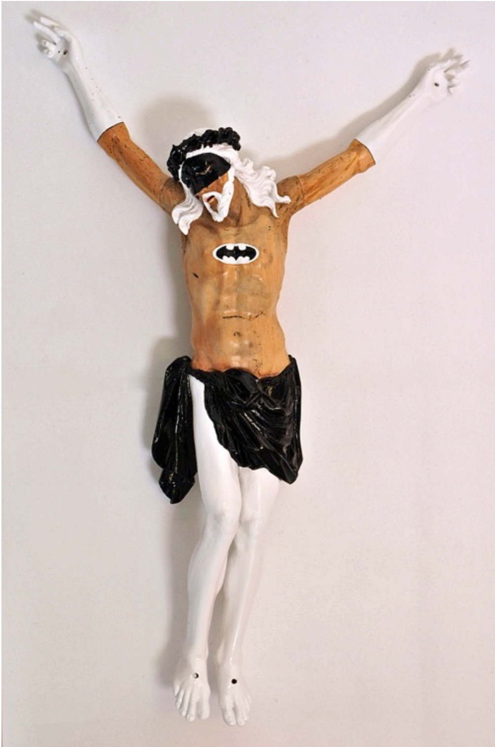
HUMANITY, 2014. 115x70 X17cm. Sculpture bois polychrome