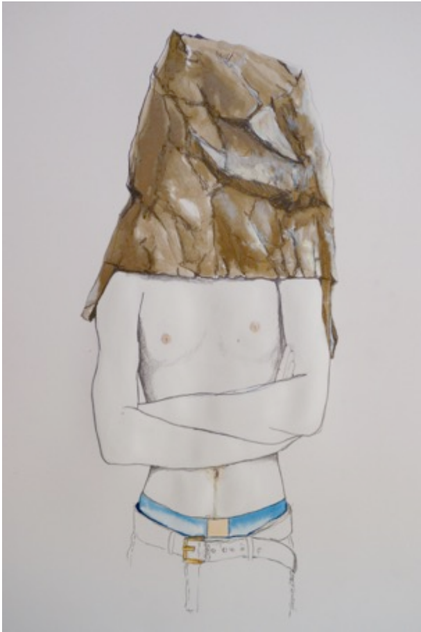
INVISIBLE(S), 2016. 50x65 cm aquarelle sur papier