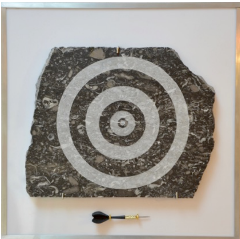
GAME OVER, 2013. 50x50 cm. Gravure sur noir, flechette support plexiglass . Cadre aluminium