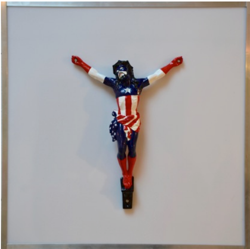
GOD SAVE ME, 2016. 50x50 cm. Christ polychrome en métal, support plexiglass . Cadre aluminium