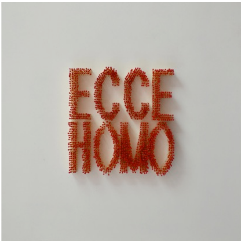
ECCE HOMO, 2015. 60x60 X7cm. Texte en allumettes sous caisson plexiglass