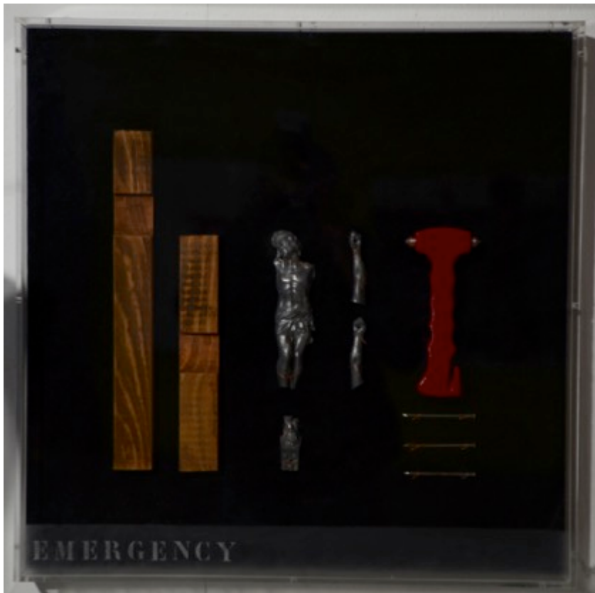
EMERGENCY, 2012/2016. 60x60 X7cm. Bois, métal, marteau de secours sous caisson plexiglass