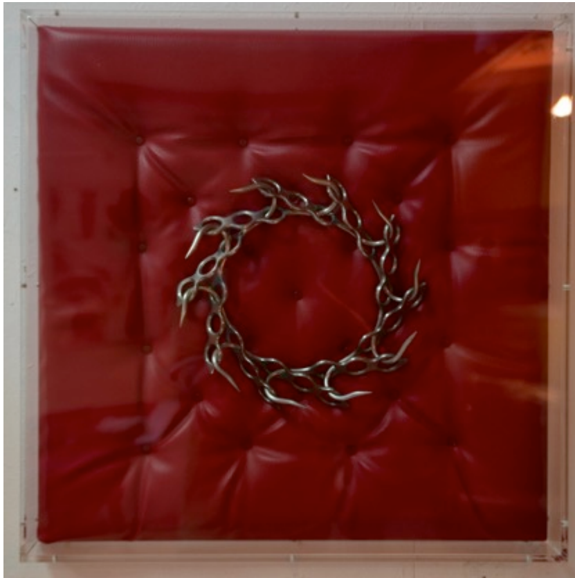
PASSION, 2015. 60x60 X7cm. Crochets de boucher en inox, tissu simili cuir rouge, sous caisson plexiglass.