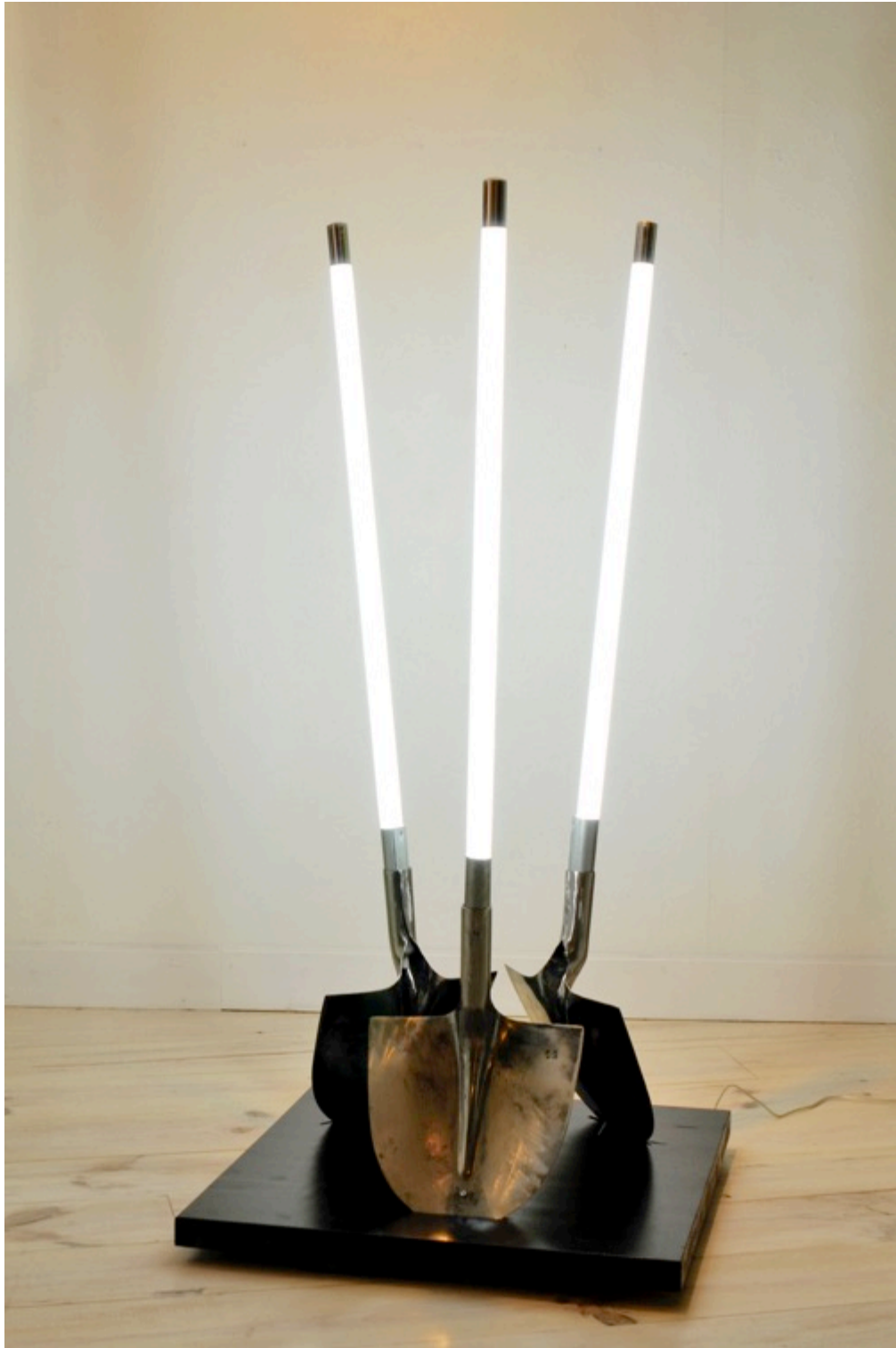
GOLGOTHA, 2013 ; 140X65X65 cm pelles métal, tubes fluorescents blancs, socle bois, plexi